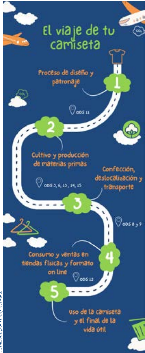
Figura 2 El viaje de tu camiseta - lineal

Te planteamos que pienses en una camiseta que tengas en casa y con esa premisa iremos viajando a lo largo de todo su proceso desde su inicio hasta su fin de vida. La trazabilidad y transparencia son básicos para poder lograr una transformación. La trazabilidad nos hace estudiar, recopilar y sistematizar todos los datos de la cadena de valor de cada prenda y la transparencia es la comunicación de toda esa información. Los dos se complementan y refuerzan.