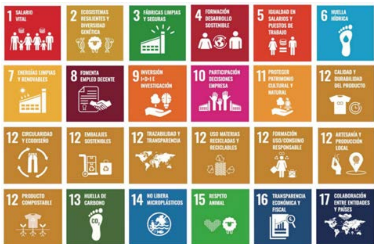
Figura 1 Objetivos de Desarrollo Sostenible