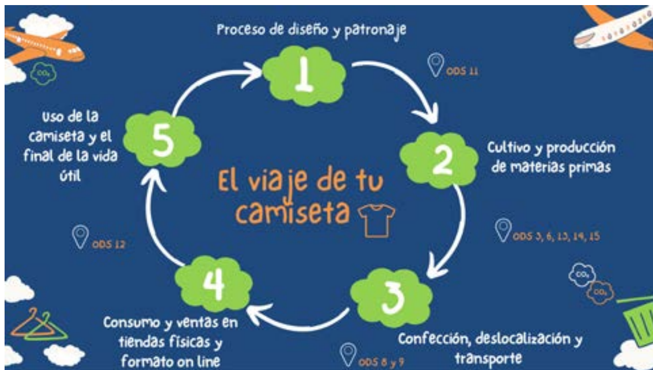
Figura 4 El viaje de tu camiseta – circular